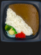
インデラ スパイスカレー