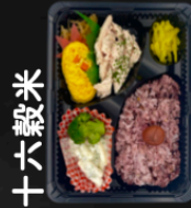
ヘルシー サラダチキン