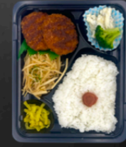
☆ぼたてカツ ☆竹の子のバター醤油焼き