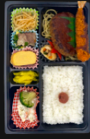
味わい ハンバーグ御膳