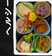
ヘルシー おまかせ6マス