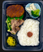
☆たっぷりキャベツと 豚バラの塩タレ ☆牛肉コロケ