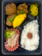
たまり醤油唐揚げ 黒胡椒風味