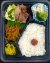
☆豚生姜焼き ☆ゴボウの甘辛煮