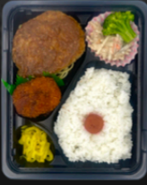
☆ビックハンバーグ 和風ステーキソース ☆蟹クリームフライ