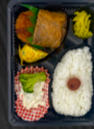
国産サバの味噌煮