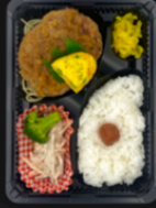
ハンバーグ 照り焼きソース