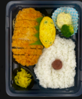
☆豚ロースカツ ☆玉子焼き