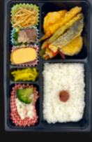
味わい 天ぷら御膳